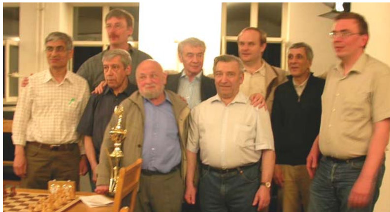
FV Schach-Pokalsieger 2006/07 : SK Präsident